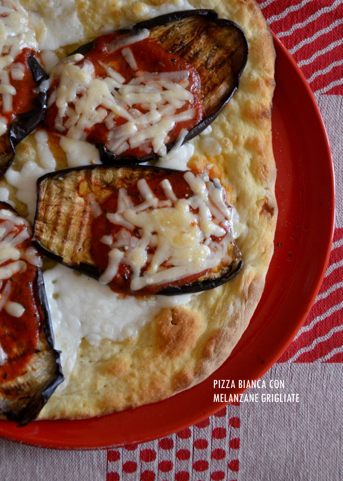
PIZZA BIANCA CON MELANZANE GRIGLIATE