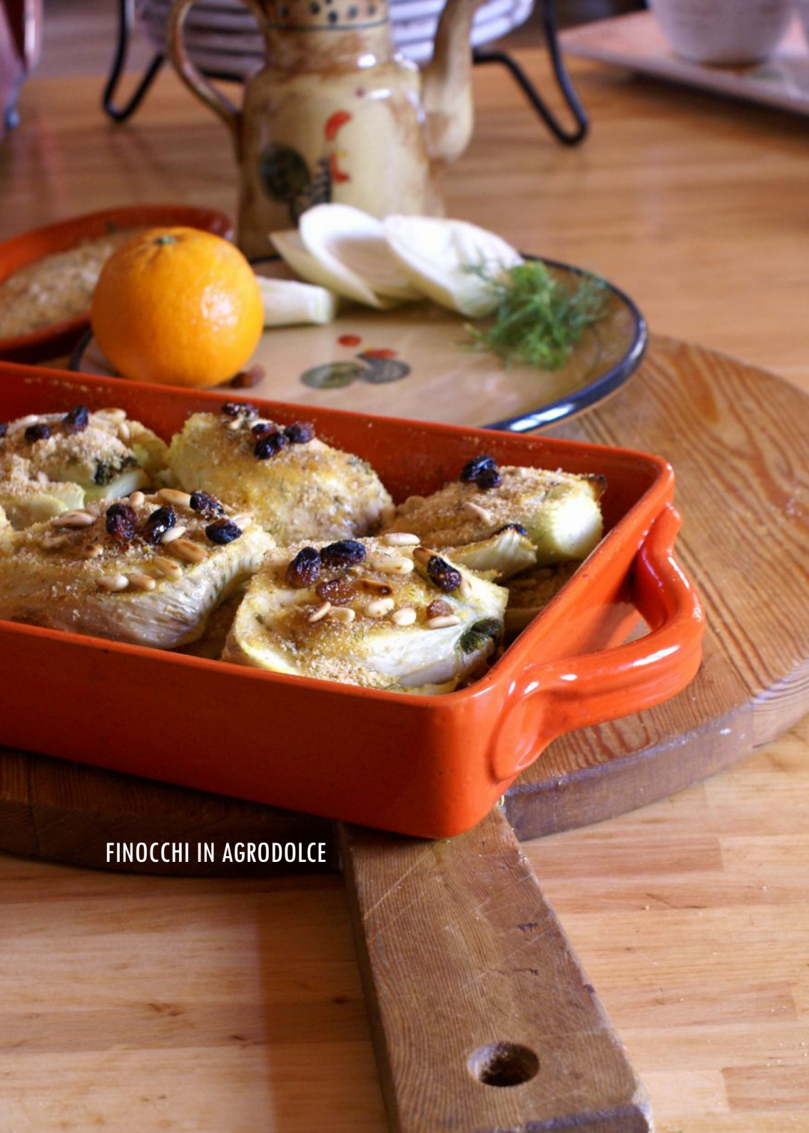
FINOCCHI IN AGRODOLCE