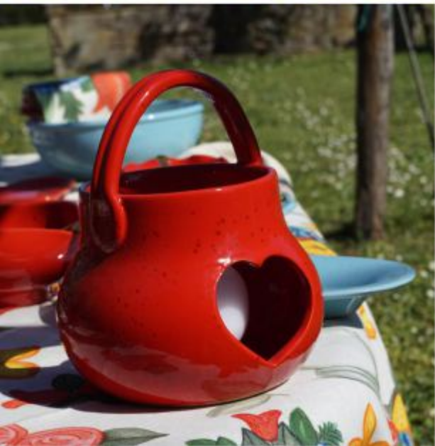
TABLE SETTING LA TAVOLA

Parola d'ordine: romanticismo agreste-chic per un week end in campagna, eccentrico al punto giusto e opportunamente colorato. A dominare sono i toni dell'azzurro e del rosso, che lasciano spazio a nuance intense e luminose del giallo e del verde. Per una scenografia che risponde ai desideri di uno stile classico ma dalla forte personalità.