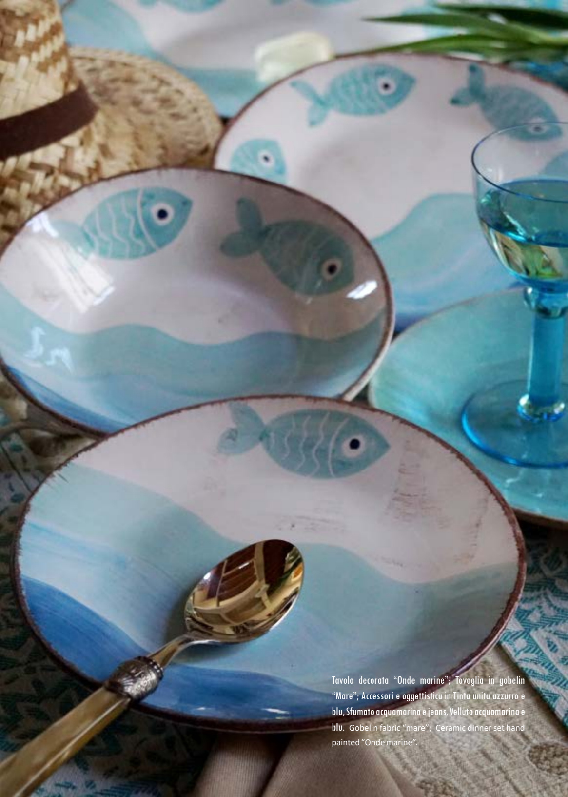
Tavola decorata "Onde marine"; Tovaglia in gobelin "Mare"; Accessori e oggettistica in Tinta unita azzurro e blu, Sfumato acquamarina e jeans, Velluto acquamarina e blu. Gobelin fabric "mare"; Ceramic dinner set hand painted "Onde marine".